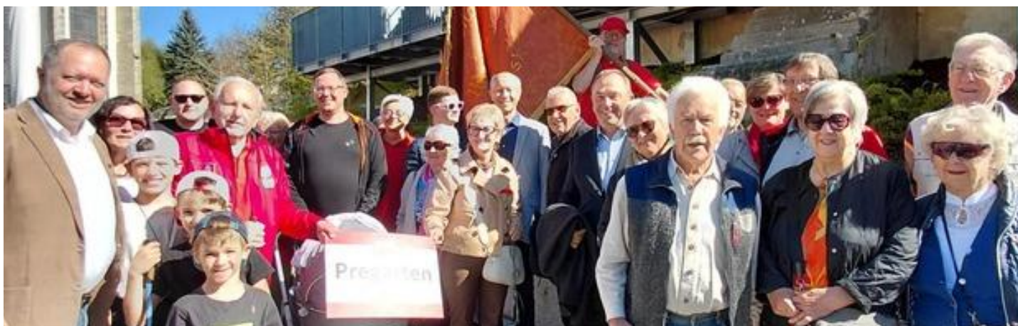
Die Abordnung der SPÖ-Pregarten im Zentrum von Kefermarkt