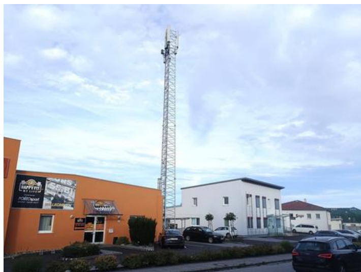
Mobilfunkmasten in der Tragweinerstraße

Denn das „Deregulierungsgesetz“ stellt ausdrücklich klar, dass sie „ungeachtet der am Standort vorhandenen Flächenwidmung sowie eines allenfalls geltenden Bebauungsplans oder Neuplanungsgebiets errichtet werden können“. In der Erläuterung des Gesetzestexts steht sogar wortwörtlich der Zweck dieser Gesetzesänderung drinnen: „Damit wird verhindert, dass Gemeinden die Errichtung von Funkanlagen durch planerische Maßnahmen unterbinden können.“ Das kommt in diesem Kompetenzbereich einer Entmündigung gleich. Musste bisher von den Betreiberfirmen der Konsens mit den Gemeindevertretern gesucht werden, so gilt das in Zukunft nicht mehr.