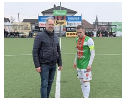
Matchballsponsor und Ehrenanstoß bei unserer SPG-Pregarten.