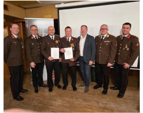
Ehrung für langjährige Mitglieder der FF Pregatsdorf