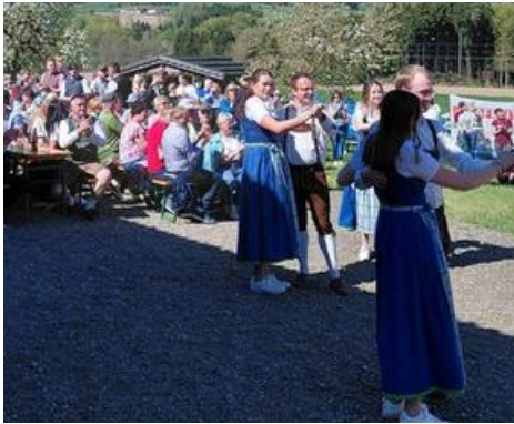
Regier Besuch bei der Mostkost in Burbach bei Fam. Lengauer inkl. Auftanz der Volkstanzgruppe .