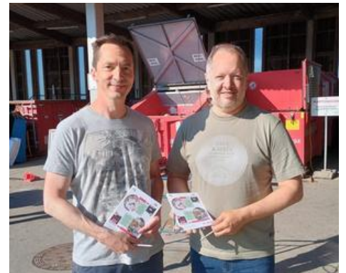
Tag der Abfallwirtschaft im Altstoffsammelzentrum (ASZ) Pregarten. Wie jedes Jahr stellen sich Mitglieder des Gemeinderats zur Verfügung und verteilen Geschenke des Bezirksabfallverbandes an die fleißigen Mülltrenner, die während des Vormittags das ASZ aufsuchen. Danke an all jene, die durch ihre konsequente Abfalltrennung einen doppelt positiven Beitrag leisten : einerseits für die Umwelt, andererseits profitiert auch die Stadtgemeinde von den Erlösen aus der Abfallwirtschaft.