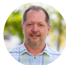
Alexander Skrzypek | Vizebürgermeister

Investitionen in die Bruckmühle: Im Bereich der Landesmusikschule wurden die ca. 25 Jahre alten und undichten Dachfenster umfassend erneuert. Das Flachdach im Bereich des Proberaums des Musikvereins wurde ebenso saniert, nachdem es zu Wassereintritten gekommen war. Die Gesamtinvestition für beide Projekte beläuft sich auf rund 277.000 Euro brutto und trägt nun zum langfristigen Erhalt der Gebäudeinfrastruktur bei.